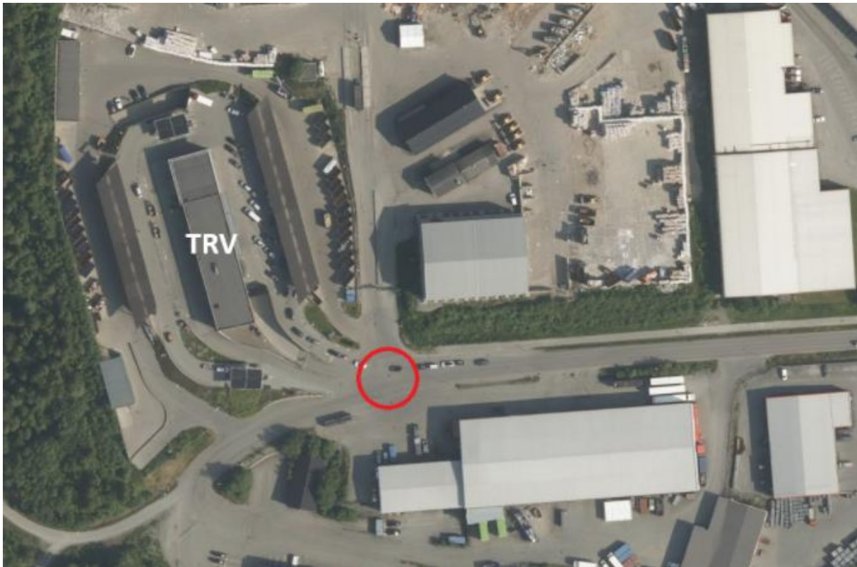
Skisse plassering rundkjøring – TRV, Gjenvinningsstasjon